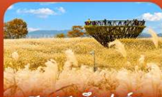
สวนฮานิลปาร์ค