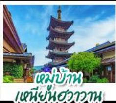
หมู่บ้าน เหมียนฮวาวาน