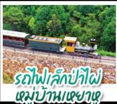
รถไฟเล็กป่าไผ่ หมู่บ้านหย่าหู