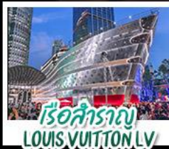
เรือสำราญ LOUIS VUITTON LV