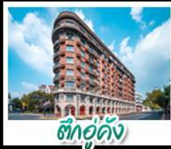
ตึกอุ๋คิง

หอไข่มุก - เทาหวงไ่ชวาน - วัดพระใหญ่หลังซันต้าฝอ เรือสำราญ LOUIS VUITTON LV - ดึงอุ๋คิง รถไฟเล็กป่าไผ่หมู่บ้านหย่าหู - หมู่บ้านเหมียนฮวาวาน