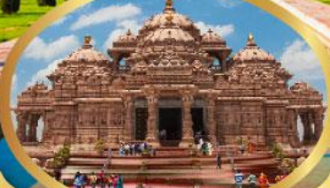
วิหารอักซาร์ดีม